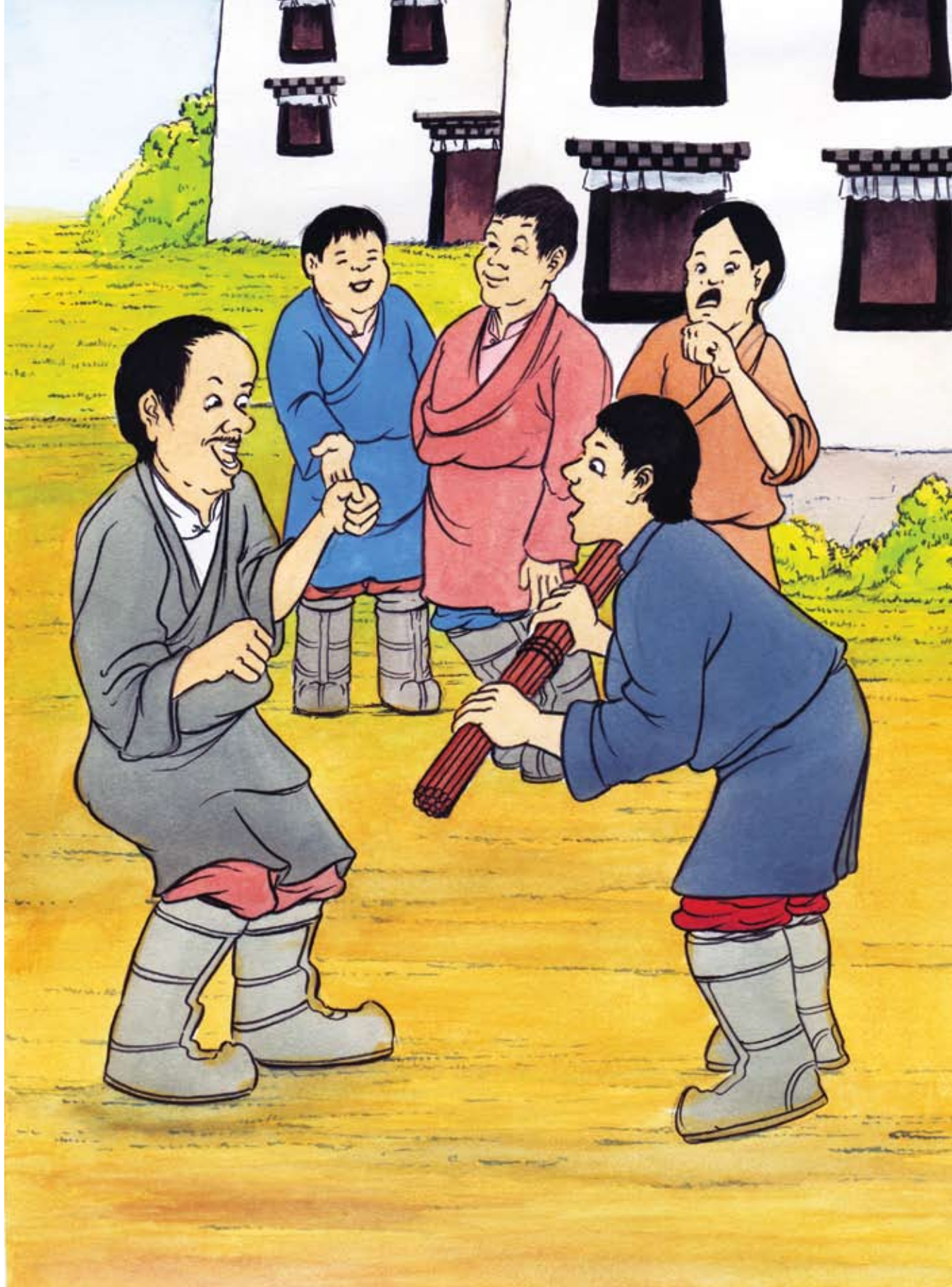
ནང་དོན། ཆིག་སྐྱེལ་གྱིས་སྟོབས་ལུགས་འཕེལ།

༄༅། གནམ་མཐོ་མོ་བྱིས་ཚང་ཞིག་ལ་བྱ་མང་པོ་ཡོད་ཀྱང་ཁོང་ཚོ་ཕན་ཚུན་ཉུག་པར་ཚོད་པ་ རྒྱག་གིན་བསྐྱེད་པ་ལས་འཆམ་མཐུན་གྱི་འཚོ་བ་ཞིག་སྐྱེལ་གྱི་མེད། ཁོང་ཚོའི་པ་ལགས་ཀྱིས་དེའི་ ཐོག་བསྐྱེད་བྱ་གཞི་དེ་བརྒྱབ་ཀྱང་ཕན་ཐོགས་གང་ཡང་མ་བྱུང་བས་སྤྱ་གྲུ་ཚོའི་ཆེད་དུ་བསམ་སྒོ་ མང་པོ་གཏོང་དགོས་བྱུང་བ་རེད། ཁོང་གི་འདོད་པ་ནི་སྤྱ་གྲུ་ཚོར་འཆམ་མཐུན་དང་ཞི་འཇམ་རྩོ་ རྒྱུད་ལྡན་པའི་བྱིས་ཚང་ཆེན་པོ་ཞིག་བྱུང་ན་སྐྱེས་པ་དེ་རེད། ཉེན་ཤས་རིང་ཁོང་གིས་བསམ་སྒོ་ མང་པོ་ཞིག་བཏང་ནས་ད་ཆ་སྤྱ་གྲུ་ཚོར་བསྐྱེད་བྱ་རྒྱག་རྒྱུའི་ཐབས་ཤེས་ཤིག་རྟོན་པ་རེད། དེའི་ ཞོགས་པ་ཁོང་གིས་སྤྱ་གྲུ་ཚོར་དབྱུག་པ་ཆག་པ་གཅིག་འབྲེལ་ཤོག་གསུངས་པ་རེད། སྤྱ་གྲུ་ཚོས་ དབྱུག་པ་ཆག་པ་གཅིག་འབྲེལ་ཡོང་དུས་ཁོང་གིས་དབྱུག་པ་ཆག་པ་དེ་རྒྱག་བཅག་གཏོང་བྱུང་བ་ རྱེད་དགོས་ཞེས་གསུངས། སྤྱ་གྲུ་ཚོས་ཐབས་ཤེས་གང་དྲག་བྱས་ཀྱང་དབྱུག་པ་ཆག་པ་དེ་བཅག་ མ་བྱུང་བས་སྤྱ་གྲུ་ཞིག་གིས། དབྱུག་པ་ཆག་པ་དེ་འདྲ་ང་ཚོས་ག་པར་བཅག་བྱུང་གི་རེད་དམ་ དེ་ལས་ང་ཚོས་རྒྱང་རེ་རེ་བྱས་ནས་བཅག་ཚོག་ཅེས་བཤད། པ་ལགས་ཀྱིས་དེ་མ་ཐག་ཉུག་ཉུག་ རེད། ད་རྒྱང་རེ་རེ་བྱས་ནས་བཅག་ན་ཆགས་ཀྱི་འདུག་གམ་ལྟོས་དང་། ཞེས་གསུངས། སྤྱ་གྲུ་ཚོས་ ཆག་པ་བཀོལ་ཉེ་རྒྱང་རེ་རེ་བྱས་ནས་བཅག་དུས་ལག་པས་ལས་སྐྱོ་པོར་བཅག་བྱུང། པ་ལགས་ ཀྱིས་ སྤྱ་གྲུ་ཚོ། བྱེད་ཚོས་དེའི་ཐོག་ནས་ཆིག་སྐྱེལ་བྱུང་ན་སྟོབས་ལུགས་ཆེ་བ་ཡོད་པ་དེ་ཤེས་ཀྱི་ འདུག་གམ། གལ་ཏེ་བྱེད་ཚོ་གཅིན་གཅུང་ཚང་མ་གཅིག་ཕན་གཅིག་ལོགས་ཀྱིས་འཆམ་མཐུན་ བྱུང་ན་ཕྱིར་དག་པོ་གང་འདྲ་ཞིག་གིས་ཀྱང་བརྟམ་བཅོས་བྱེད་བྱུང་གི་མ་རེད། གལ་ཏེ་བྱེད་ཚོ་ ཆིག་སྐྱེལ་མ་བྱུང་བ་ཡིན་ན་དབྱུག་པ་རྒྱང་གཅིག་ནང་བཞིན་ལས་སྐྱོ་པོར་དག་པོས་ཕམ་ཉེས་ གཏོང་གི་རེད། ཅེས་གསུངས་པས་སྤྱ་གྲུ་ཚོས་སྤྱ་གྲུ་ཚོས་སྤྱ་གྲུ་ཚོས་སྤྱ་གྲུ་ཚོས་སྤྱ་གྲུ་ཚོས་སྤྱ་གྲུ་ཚོས་ རེད།